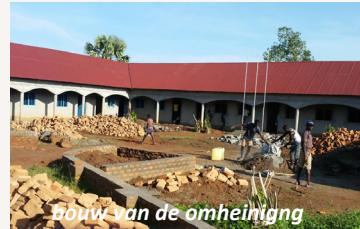
bouw van de omheining

Om de bouwkosten van het hekwerk laag te houden helpen ouders en leerkrachten met het werk.