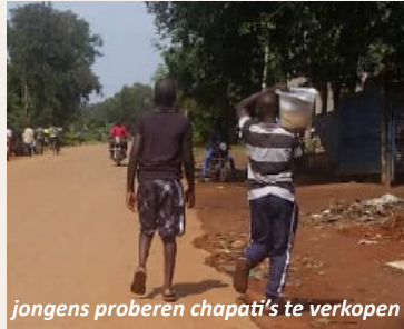
jongens proberen chapati's te verkopen

De Coronacrisis raakt het kwetsbare Afrika extra hard. Besmettingen nemen toe en de maatregelen en lockdown dreigen opnieuw. Die zijn voor de economie desastreus. Ze veroorzaken honger en achteruitgang. Winkels en kleine bedrijven starten langzaam op, waardoor sommige ouders deels weer aan het werk waren. Maar het vervoer lag nog grotendeels stil. Het is duidelijk te merken dat aan alles tekort is. Mensen hebben beduidend minder om van te leven dan 1,90 dollar per dag, wat volgens de Verenigde Naties de armoedegrens is. Er is nauwelijks geld voor eten en iedereen probeert met scharrelen iets te verdienen om voedsel te kopen. De mensen zijn zeer vindingrijk in verzinnen van klusjes tegen betaling. Kinderen moeten helpen om een centje bij te verdienen of wat te eten te vinden. Ze kunnen water halen, als hulpje in een winkel werken, of ouderen helpen. Ook met ruilhandel zoeken ze oplossingen: bonen tegen maismeel.