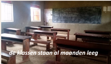
de klassen staan al maanden leeg