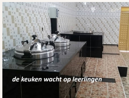
de keuken wacht op leerlingen

Leraren aan het werk zetten met lesgeven op afstand. Ouders halen huiswerkopdrachten op school af, brengen het later terug en krijgen dan nieuwe opdrachten mee. De frequentie is afhankelijk van de klas van hun kind. Schools for Youth wil de salarissen van leerkrachten en de kosten voor het huiswerk sponsoren, van september tot en met december. Dat kost zo'n 2000 euro per maand.