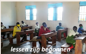
lessen zijn begonnen

Met uw hulp hebben we een respectabel bedrag kunnen overmaken om de meest noodzakelijke aanpassingen te kunnen uitvoeren. Allereerst de beveiliging. Er komt een hek om de school met metalen poorten, om ongenode gasten, zowel dieren als mensen, buiten te houden. Ook de ramen en deuren worden voorzien van glas. In hygiënische maatregelen, zoals zeppompjes en ontsmettingsmateriaal om corona aan te pakken wordt voorzien en de slimme temperatuurmeters gaan zorgen voor een snelle observatie.